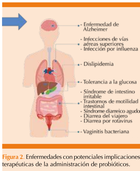
Figura 2. Enfermedades con potenciales implicaciones terapéuticas de la administración de probióticos.

colonización por bifidobacterias en los lactantes nacidos por vía vaginal en comparación con los obtenidos por vía abdominal, aunque todos los infantes fueron colonizados por bacterias entéricas aerobias. Los rangos de colonización por bacterias tipo bifidobacteria y las bacterias del género Lactobacillus fueron menores en los nacidos por cesárea que en los nacidos por vía vaginal. La colonización por Clostridium perfringens fue significativamente mayor en el grupo nacido por cesárea que en los nacidos por vía vaginal al mes de edad. Los rangos de colonización por Bacteroides fragilis difirieron marcadamente entre los grupos de estudio. La colonización por bacteroides tuvo un intervalo de 52 a 79% en los niños nacidos por vía vaginal mientras que en los nacidos por vía abdominal los grados de colonización siguieron siendo significativamente menores en el grupo nacido por cesárea que en el grupo nacido por vía vaginal (36 vs 76%, p < 0.009 ) a los dos y seis meses de edad. 3